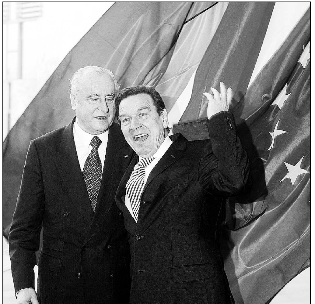
Zum Abschluss des letzten Staatsbesuches seiner Amtszeit traf Bundespräsident Thomas Klestil Deutschlands gut aufgelegten Bundeskanzler Gerhard Schröder.

Am Freitag soll weiter verhandelt werden. Rot-Grün besteht offenbar nicht mehr darauf, den Anwerbestopp für ausländische Arbeitnehmer aufzuheben. Die Union fordert dagegen eine Abschiebung all jener Ausländer, die im Verdacht stehen, mit Terrorismus zu tun zu haben.